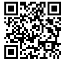
申込ページQRコード