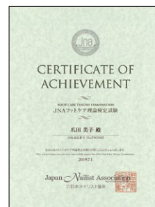
合格証書(ディプロマ) ※イメージ