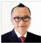
山田五郎 Goro Yamada (美術評論家/コラムニスト)