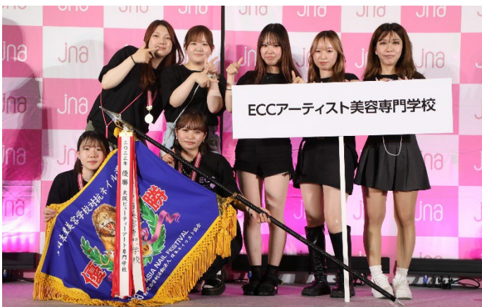
全日本理美容学校対抗ネイル選手権 優勝校（チーム） ECC アーティスト美容専門学校 TAKENOKO