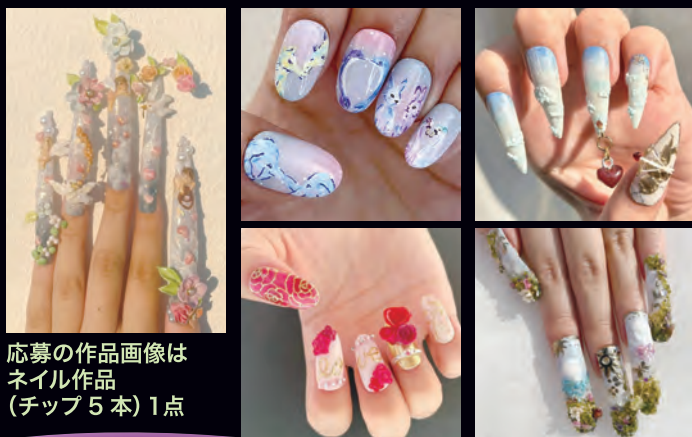
応募の作品画像は ネイル作品 (チップ5本) 1点

ネイル作品 (チップ5本) を制作 [ 出場資格 ] 全ての JNA 認定校の在校生