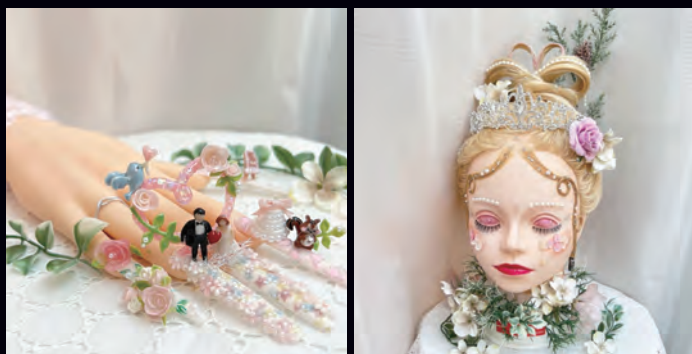
<ネイル作品> & <ヘアメイク作品>

ネイル作品 (チップ5本) & ヘアメイク作品を制作 [ 出場資格 ] JNA 認定校「理美容ネイル学科」「理美容ネイル専攻学科」の在校生